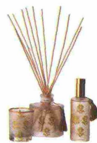
Luci di Natale Diffusore, spray e candela alla mirra, vaniglia, may chang e gelsomino, Villa Buti (da 24,50 euro).