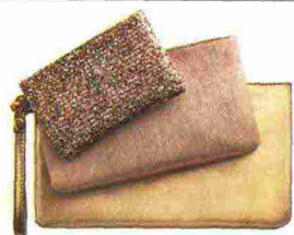
Da viaggio Trousse in tre misure, Makeup Bag Trio di Sephora (16,90 euro).