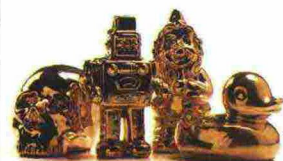
Miniature In porcellana placcate oro, Seletti (da 40 euro l'una).