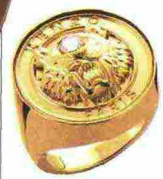
Maxi Anello in argento dorato con zircone, Kenzo (129 euro).