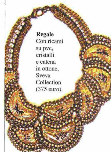
Regale Con ricami su pvc, cristalli e catena in ottone, Sveva Collection (375 euro).