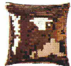
Glam Cuscino con paillettes, H&M (14,99 euro).