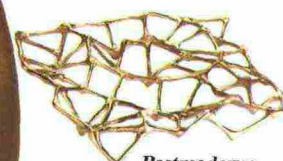
Postmoderno Centrotavola in ottone, Tom Dixon (293 euro).