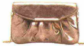
Da sera Pochette in ecopelle, Carpisa (19,90 euro).