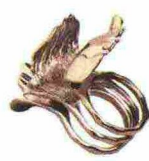
Alato Anello in ottone, & Other Stories (35 euro).