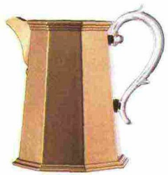
Ottaviana Brocca in acrilico, Mario Luca Giusti (70 euro).