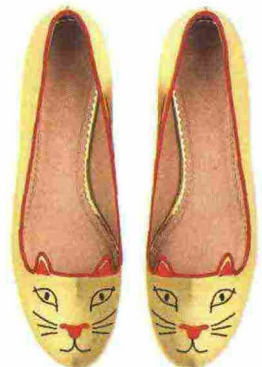
Ricamate Ballerine in satin, Charlotte Olympia (525 euro).